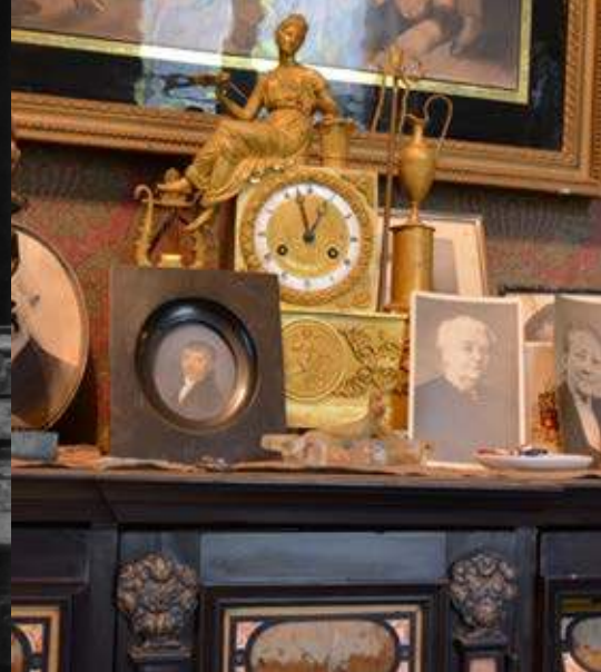
Detail kleine salon