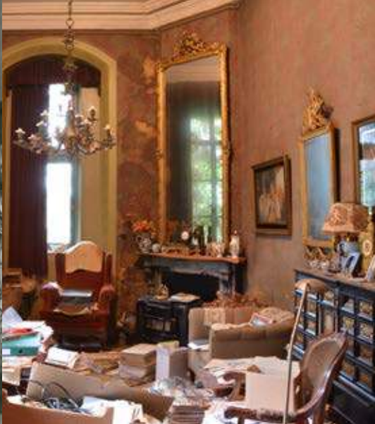
2017 kleine salon