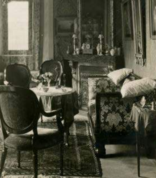
Jaren '30 Kleine salon