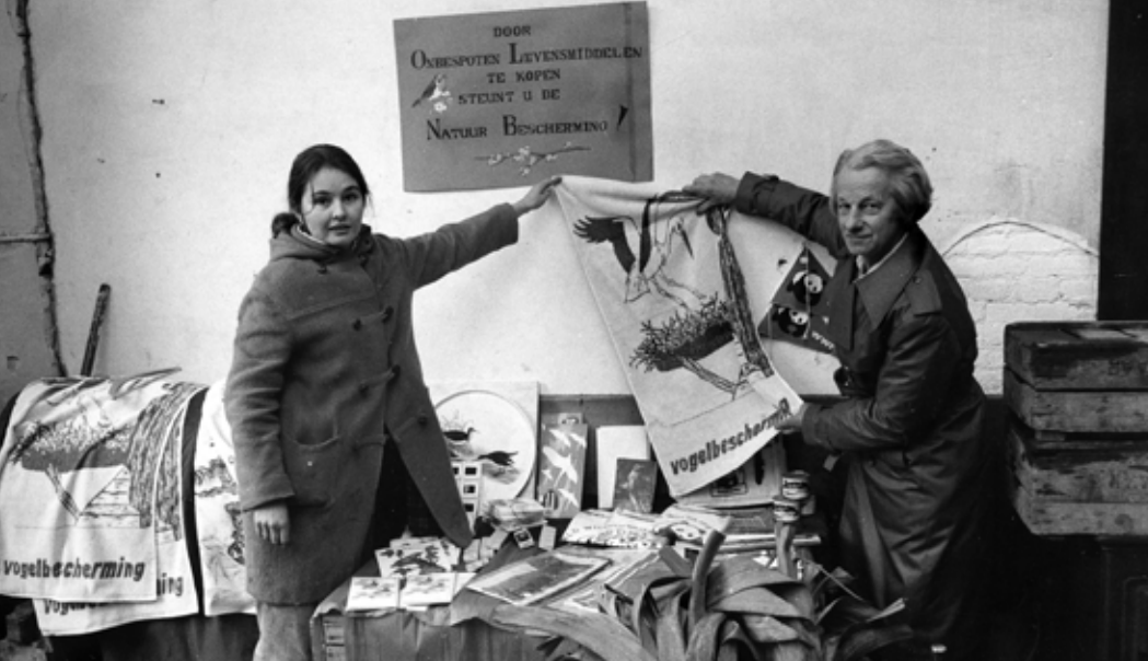
Jaren '70 Groenteverkoop met vogelbeschermingsartikelen